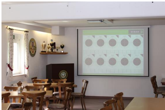
Aufenthaltsraum mit Videowand