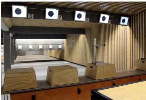
10 Elektronische Luftdruckwaffenstände 10m